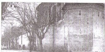
Бригистская ул. Карла Маркса. 70-е гг.