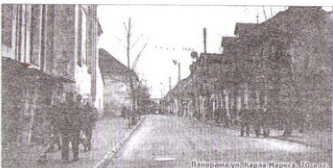
Валерана ул. Карла Маркса. 30-е гг.